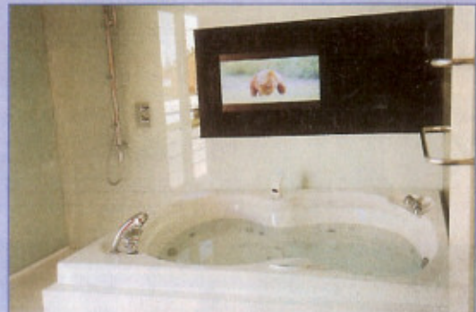
O "mordomo virtual" pode mandar aquecer a água da banheira