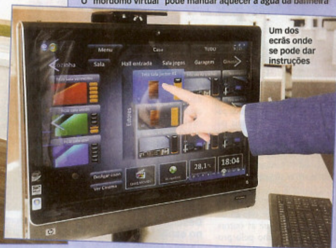
Um dos ecrãs onde se pode dar instruções

PAULA FREITAS FERREIRA | TEXTO ANA PEREIRA | FOTOS